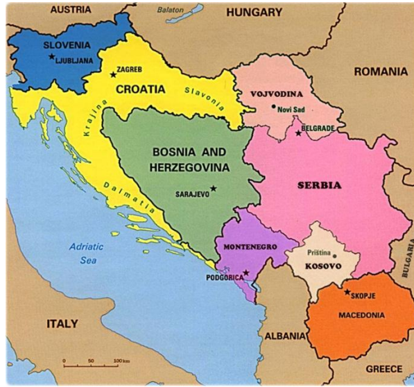
Eski Yugoslavya Haritası

Zaman ilerlediği müddetçe savaş biçimleri farklılıklar göstermiştir. 20. Yüzyılın başından sonuna dek BM literatürüne; “soykırım 5 ”, “insanlığa karşı işlenmiş suçlar 6 ”, “savaş suçları 7 ” ve “etnik temizlik” terimleri girmiştir. İlk üç terimden farklı olarak “etnik temizlik” uluslararası hukuka girmemiştir. Etnik temizlik, BM Uzmanlar Komisyonu tarafından “Başka bir etnik veya dini grubun belirli bir bölgeden ayrılması için güç kullanımı veya sindirme yoluyla etnik olarak homojen bir alanın oluşturulması” şeklinde tanımlanmıştır. 1990’larda, Eski Yugoslavya coğrafyasında ortaya çıkmış, Sırbistan ve Hırvatistan tarafından desteklenen Bosnalı Sırpların ve Bosnalı Hırvatların siyasi hedefi olan “etničko čišćenje” ifadesinin, bu coğrafyadaki uzlaşmazlıklar üzerine çalışan BM uzmanları tarafından İngilizceye çevrilmesi ile BM literatürüne girmiştir. 8 Sırbistan ve Hırvatistan’ın “etnik temizlik” politikaları yürütmelerinin siyasi amacı, Bosna-Hersek’in kendi sınırlarına yakın olan bazı bölgelerinde kendilerinin nüfusunun fazla olduğu iddiası ile “self determinasyon” yani “ulusların kendi kaderini tayin” ilkesi ile Bosnalı Sırp ve Hırvatların bu toprakları Sırbistan ve Hırvatistan ile birleştirmelerine yöneliktir.