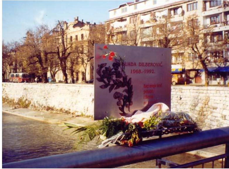
Suada Dilberovic'in Öldürüldüğü Köprü – Suada Köprüsü

ülkedir. 5 Nisan 1992’de savaşı başlatan bir “Barış Mitingi” idi. 5 Nisan 1992 tarihinde Suada Dilberovic savaşın ilk kurbanı oldu ve 6 Nisan’da Sırların Saraybosna kuşatması başladı.