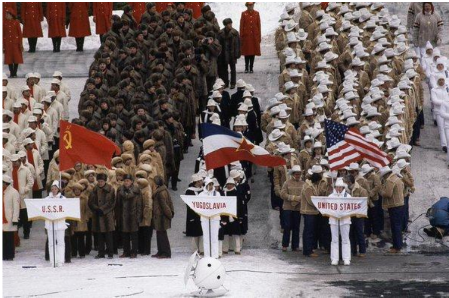
1980 Kış Olimpiyatları – Yugoslavya'nın Uluslararası Politikadaki Konumuna İlişkin

Savaşın bilişsel kısmını oluşturacak tohumların çoğu toplumun uzun zamandır bünyesinde bulunmaktaydı. Ancak her zaman tohumun filizlenmesi, kendini ortaya çıkarması için başka şeylere ihtiyaç duyulur. Siyasette pek çok dönemde olduğu gibi Yugoslavya içinde de bu şey ekonomik krizdi. Yugoslavya'nın Batı bloku ile arası iyiydi. Çünkü Batı bloku Yugoslavya'yı, Batı Avrupa'yı SSCB'den koruyabilecek bir tampon bölge olarak görüyordu ve mali yardımlarda bulunuyordu. 1970'li yıllara gelindiğinde Yugoslavya'ya verilen mali yardımlar azalmaya başlamıştı. Bu durum ülkeyi ticari kredilere itti ve bir müddet sonra ülke içerisindeki federal cumhuriyetler ve özerk iller birbirleri ile yarışır duruma geldiler. 1979'a kadar Yugoslavya'nın borcu kriz oranlarına ulaşmıştı. 1982'de Uluslararası Para Fonu'nun (IMF) kemer sıkma politikalarını içeren bir kurtarma paketi kabul edildi. Yine de 1980'lerin sonuna dek işsizlik ve enflasyon artmaya devam etti, Bosna-Hersek'te bir dizi yolsuzluk, iktidar seçkinleri ile mafya ilişkileri ortaya çıktı. Karaborsa üzerinden silahlanmalar hız kazandı. 12